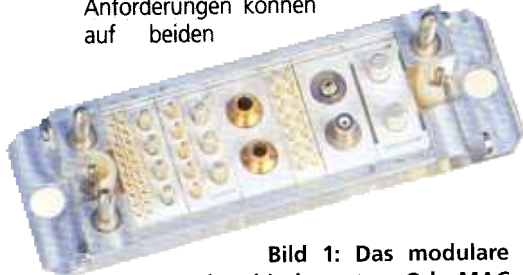
Bild 1: Das modulare Steckverbindersystem Odu MAC für den Einsatz in Magnetresonanz-Tomographen (MRI) kann nur im Prinzip gezeigt werden, weil die tatsächlichen Ausführungen der Stecker und Kontakte Geheimhaltungsabkommen unterliegen.

In (Herz-)Kathetern und beispielsweise bei der Sauerstoffmessung im Blut kommt der in Bild 4 gezeigte Push-Pull-Steckverbinder aus Kunststoff in großen Stückzahlen zum Einsatz. Es handelt sich hierbei um einen Odu MEDI-SNAP in Standard- und Sonderausführung. In den USA gibt es derzeit einen Trend zum „disposable connector“ (Wegwerf-Steckverbinder), bei dem das Geräteteil mit Griff und Katheter nach der Untersuchung wegwerfen werden. In Europa wird mehr autoklaviert und wiederverwendet. Bei der oben gezeigten Sonderausführung handelt es sich um einen zunächst in Stero-Lithografie gefertigten rechtwinkligen Stecker mit Raum für Elektronik.