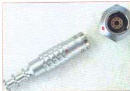
Bild 2: Odu MINI-SNAP eignet sich sehr gut für den Einsatz in Operationsgeräten mit 100 000 Steckzyklen.

Gebieten genauso hoch sein. Um eine jeweils optimale Lösung zu erzielen sind in der Medizintechnik auch außergewöhnliche Stecker nötig. Ein Beispiel dafür ist das modular anreihbare Steckersystem Odu MAC