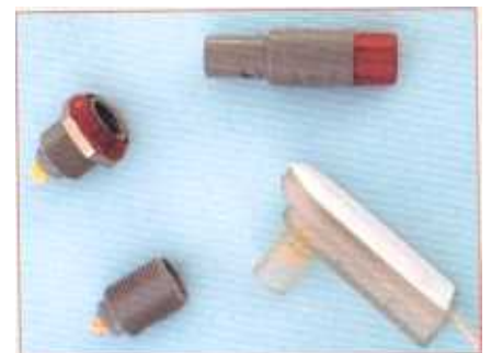
Bild 4: Push-Pull-Steckverbinder

ist der Isolierkörper aus PEEK gefertigt. Über den in Bild 3 gezeigten Stecker mit direkter Verbindung zur Pumpe laufen die Leistungsströme zur Pumpe und die Signale von dort. Es handelt sich hierbei um einen Steckverbinder des Typs Odu MINI-SNAP PC in einer Sonderausführung für den Einsatz in Geräten zur Herz-Unterstützung. So ist der Steckverbinder unter anderem nach DIN EN 60 601-1 mit erhöhten Luft- und Kriechstrecken ausgelegt. Er ist umspritzt, wasserdicht und neben der Push-Pull-Funktion mit einer Abreißfunktion versehen. Ein Ausfall des Steckers könnte zum unmittelbaren Tod des Patienten führen.